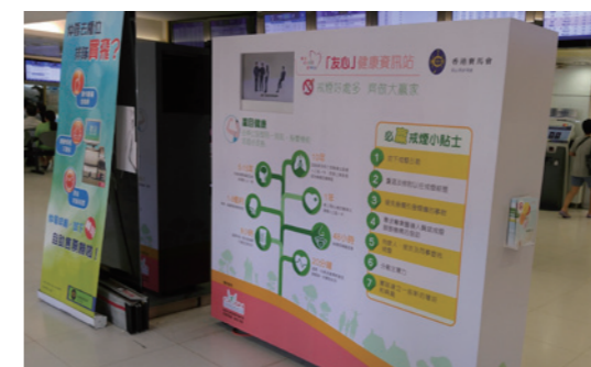
▲ 馬會的「友心健康資訊站」展板展示無煙資訊及派發小冊子，向市民推廣健康生活。 HKJC set up exhibition boards and distribute pamphlets to promote a healthy lifestyle among the general public.

未來，馬會將持續推動無煙文化，利用投注處內的空間，舉辦更多不同的推廣活動，包括健康講座及一氧化碳呼氣測試等，進一步向市民宣揚無煙生活的好處。馬會亦計劃與委員會合作在投注處內設立「戒煙大贏家」招募攤位，鼓勵市民參與戒煙比賽，成為無煙大家庭的一分子。