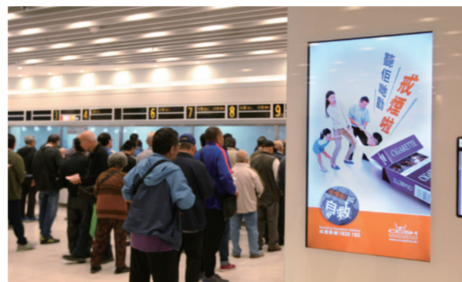
▲ 投注處內的電子屏幕展示不同的無煙海報，以推廣無煙信息。 Digital posters were displayed at Off-course Betting Branches to promote smoke-free messages.

馬會於遍布港九新界各區的投注處定期張貼或以電子屏幕展示不同的無煙海報，亦透過「Channel JC」電視頻道播放無煙宣傳短片，以全面營造支持戒煙的氛圍。另外，馬會於2015年及2016年在10間投注處擺放「友心健康資訊站」展板，以「毒從煙來 害己害人」及「戒煙好處多 齊做大贏家」為主題，提升市民對煙草禍害的認識，同時鼓勵戒煙。