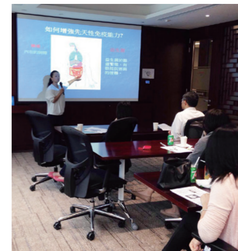
▲ 公司定期舉辦健康講座推廣無煙文化。 Health talks were organized regularly to promote a smoke-free culture.